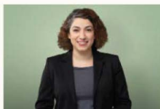
Evrim Camuz Rechtspolitische Sprecherin der Grünen Landtagsfraktion und Mitglied im Ausschuss für Rechts- und Verfassungsfragen sowie im Ausschuss für Angelegenheiten des Verfassungsschutzes