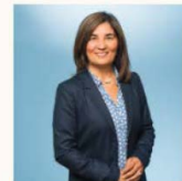
Belgin Zaman Bezirksbürgermeisterin (SPD) Buchholz-Kleefeld