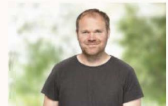
Malte Lohmann Regionsabgeordneter in der Fraktion Bündnis 90/Die Grünen, Vorsitzender im Ausschuss für Gleichstellung, Integration, Antidiskriminierung und Diversität Sprecher des Jugendhilfeausschusses (JHA)